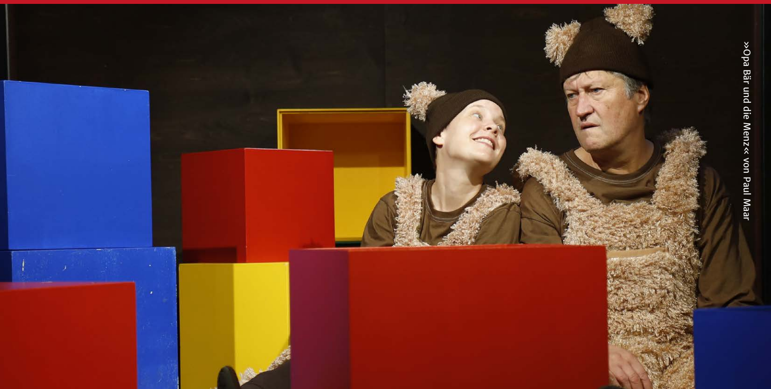
»Opa Bär und die Menz« von Paul Maar